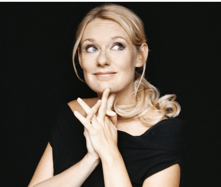
Nejúspěšnější česká operní pěvkyně současnosti Magdalena Kožená se netají tím, že jí vlastně vůbec nic nechybí

hla zvládnout. Londýnské provedení celé opery naživo bylo trochu jiné než loňské pražské koncerty fragmentů z Julietty s Českou filharmonií pod vedením Charlese Mackerrase. Dědalo se to napůl scénicky. Všichni sice zpívali z not, ale zpěváci měli na sobě kostýmy a scéna byla nasvícena, takže představení nemělo úplné koncertní charakter. Opravdu ráda vzpomínám na přijetí publika. Barbican byla vyprodaná, což není samozřejmě věc u díla, které skoro nikdo nezná. Martinů je na rozdíl od Janáčka ve světě pořád ještě nedocenen, i mnoho muzikantů se na něj dívá skepticky. Proto jsem měla ještě větší radost z toho, že mnoho lidí si po úspěchu, který Julietta právem sklídila, na hudbu Bohuslava Martinů poopravilo názor.