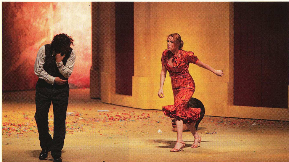
Bizet: Carmen (Jonas Kaufmann a Magdalena Kožená)

Jak překonáváte krize, pokud se objevují? Je nutné sám sebe akceptovat. Člověku se nechce si přiznat, že jsou některé věci jinak než dřív, že se na ně musí podívat jinak, že musí něco odmítnout, že si musí udělat víc času na regeneraci a na cvičení. Já jsem