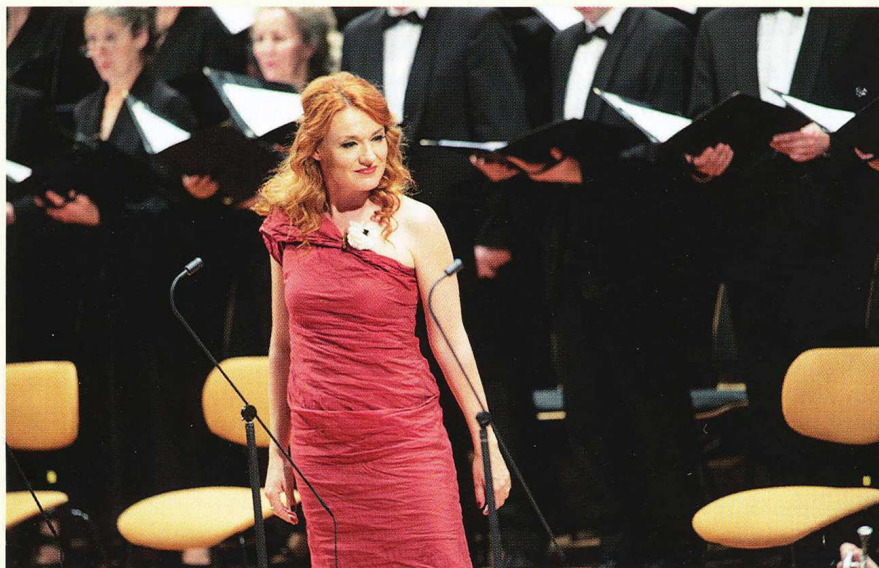
Koncertní provedení Bizetovy Carmen v Berlíně (21. 4. 2012)

Mimochodem, to opravdu počítáte jen s patnácti roky? Ne, samozřejmě doufám, že jich ještě bude víc... Ale realisticky viděno, ženské hlasy po pětadesátce mohou začít odcházet... Teď tady zpívala s mým