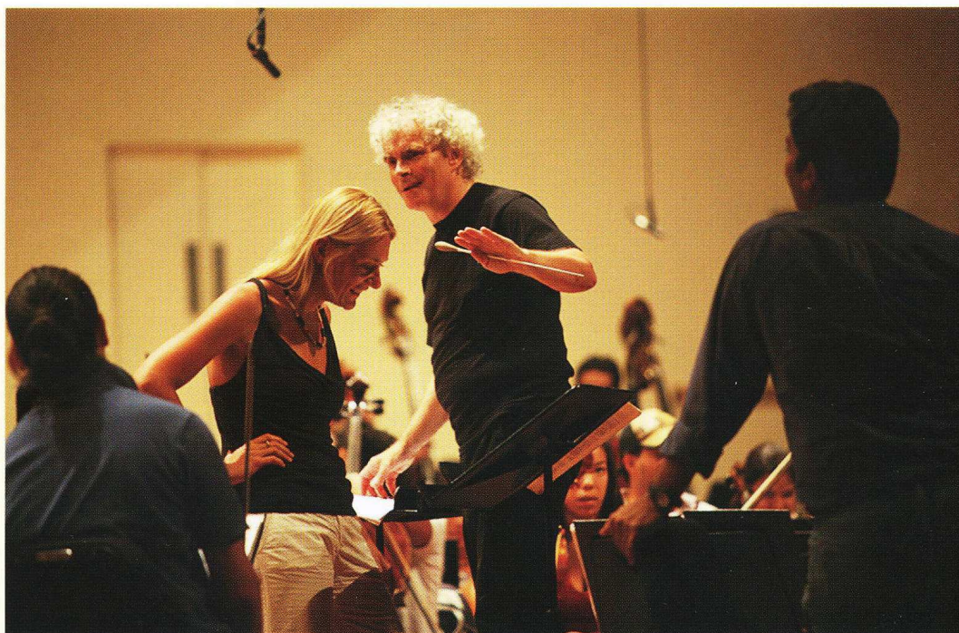
Magdalena Kožená a Simon Rattle

A co chystáte v nejbližší době pro tuzemské publikum? Prvního května se letos s manželem objevíme s Berlínskými filharmoniky při jejich tradičním Evropském koncertě v Praze – ve Španělském sále na Hra-